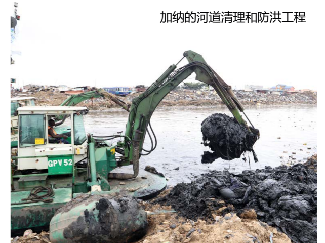
加纳的河道清理和防洪工程