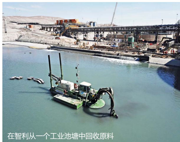
在智利从一个工业池塘中回收原料