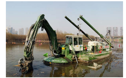
绞吸疏浚清除污泥

一整个疏浚船队集合为一台多用途设备 多才多艺的“水王”完成了工地上的所有工作。首先，它开始采用耙挖和反铲清除河道内垃圾、多余的水生植物和淤泥。然后，它接着采用绞吸作业将累积的淤泥疏浚到土工布袋中进行脱水。现场水深一般小于50厘米，这对两栖式的“水王”来说不是问题。