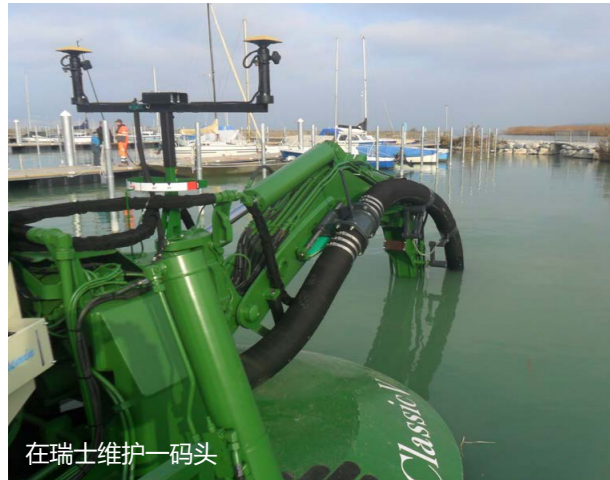
在瑞士维护一码头