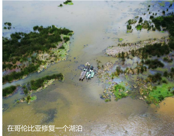
在哥伦比亚修复一个湖泊

许多水体与当地文化密不可分。它们是古代神话的发源地，编织着民族的身份和公民的日常生活。例如恒河、尼罗河和维多利亚湖的巨大文化意义是不可能完全领悟的。全球化、城市化和人口增长的压力使这些水域中的许多都受到了污染并失去平衡。采取行动恢复这些水域以提高他们的文化自豪感和整个国家的士气。“水王”，正在世界各地帮助恢复这些珍贵的水体。