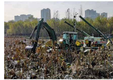
用反铲清除废弃物和淤泥

项目合作方—— 陕西丞海水务工程有限公司 幸好刚刚从芬兰引进了可用于该工程的完美技术。他们选择了 原创的“水王”两栖多用途环保挖泥船 ，因为它具有 领先的性能和绝佳的操作可靠性 。芬兰阿克迈克公司开发和制造“水王”挖泥船已有30多年的历史。该挖泥船体积小、重量轻，便于运输。适于浅水甚至无水作业。这台机器几乎可以 进入任何可以想象的工地 。在作业过程中， 不需要辅助设备 ，一艘“水王”可以完成一整个疏浚船队的工作。由于其操作精准、