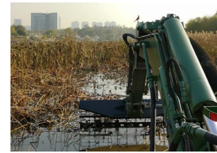
用耙子清理水生植物和垃圾