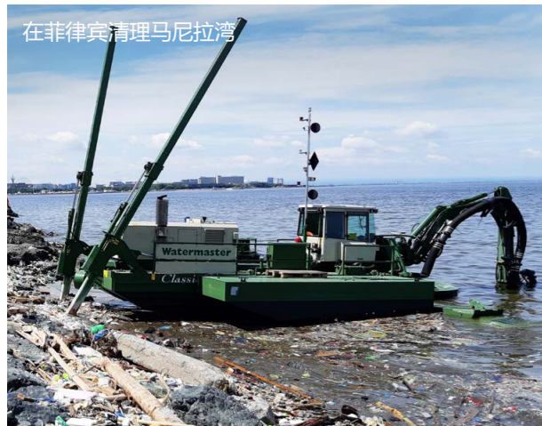
在菲律宾清理马尼拉湾