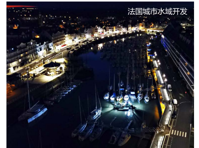
法国城市水域开发