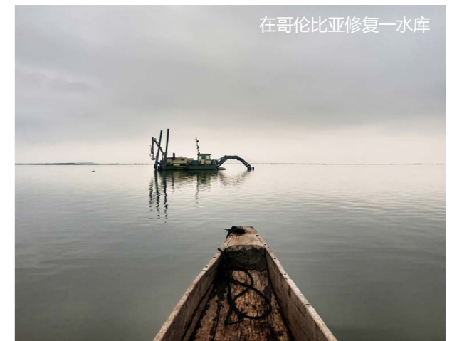
在哥伦比亚修复一水库