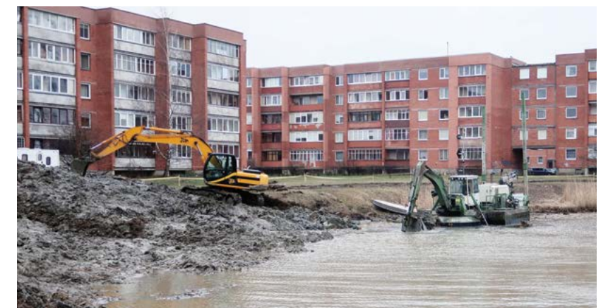
Eliminar los sedimentos - Los sedimentos se acumulan en el fondo de los ríos y los canales con el paso del tiempo. Eliminar estos sedimentos reduce el riesgo de inundaciones y mejora el flujo del agua (imagen de Lituania).