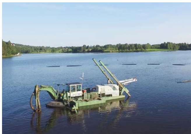
Limpiar ríos, lagos, canales y otros cuerpos de aguas poco profundas - Watermaster elimina sedimentos (contaminados) mediante el dragado por succión con la bomba de corte a tuberías de desagüe o a una cuenca de sedimentación (imágenes de Noruega).

Mantener las presas industriales en buenas condiciones es una de las actividades principales de una contratista finlandesa, Lopen maa-ja vesirakenne Oy. Ya trabajaban con una flota de maquinaria, pero sus soluciones de excavadora tenían ciertas limitaciones al trabajar en entornos acuáticos. Querían diversificar y expandir todavía más sus operaciones con la draga anfibia multipropósito Watermaster. Watermaster combina las habilidades de una excavadora y una draga, y protege de forma segura todo el trabajo en toda la zona acuática de poca profundidad hasta 6 metros. Con Watermaster, normalmente solo tienen que