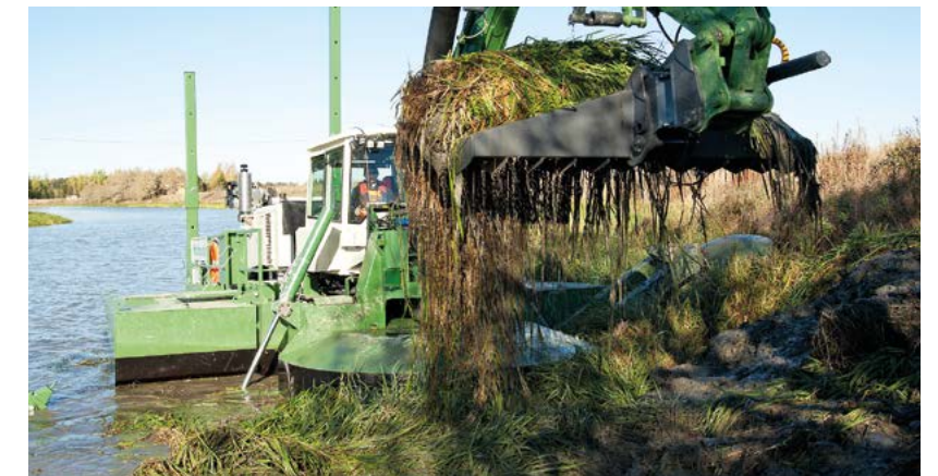
Eliminar la vegetación excesiva - Con su rastrillo, Watermaster elimina la vegetación acuática que flota en el agua y la enraizada (imagen de Finlandia).

La Unión Europea tiene las regulaciones medioambientales y de seguridad más estrictas. Las máquinas Watermaster están probadas por completo y certificadas, se fabrican en Finlandia y han funcionado con éxito en toda Europa desde 1980. De los cientos de unidades de Watermaster que hay en el mundo, aproximadamente 100 se encuentran en Europa. La mayoría de ellas son de la generación previa, Watermaster Classics, pero en el área europea también hay un número activo cada vez mayor de los últimos modelos. El Classic V es muy parecido a los modelos anteriores, pero tiene muchas mejoras. Su capacidad de dragado, por ejemplo, se ha casi triplicado desde la primera generación, convirtiéndolo en la draga anfibia multipropósito más potente (10 pulgadas, 25 cm). El desarrollo sistemático continuo y las facilidades de producción en serie modernas aseguran la alta calidad constante y el rendimiento fiable de las máquinas Watermaster.