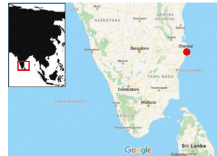
Chennai es el hogar de unos 5 millones de personas y está ubicado en la costa oriental de India

Hay muchas unidades de Watermaster limpiando y manteniendo aguas poco profundas en toda la India. Animados por los comentarios positivos