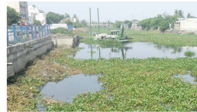
El jacinto acuático invasivo y los sedimentos excesivos causan muchos problemas.