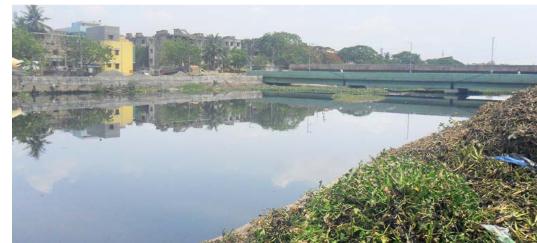
Aguas limpias y seguras para el pueblo de Chennai - Este es el sueño de la Corporación Municipal de Chennai. Watermaster les ayuda a lograrlo. La fotografía muestra el canal Captain Cotton tras el trabajo de limpieza

La Corporación Municipal de Chennai quedó rápidamente convencida de que Watermaster era la herramienta adecuada para este trabajo. La Watermaster ya había compensado su coste con tan solo seis meses de uso. El coste ahorrado de haber utilizado menos máquinas permitió a la corporación municipal invertir en otra unidad anfibia multipropósito Watermaster Classic V este año. Mejorará todavía más sus esfuerzos de recuperación y ayudará a hacer realidad su sueño de proporcionar aguas limpias al pueblo de Chennai.