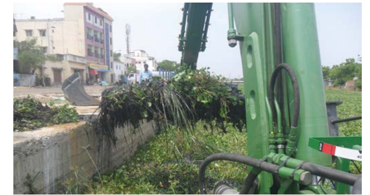
Watermaster rastrilla y quita los sedimentos y la vegetación del canal.

de muchos estados locales y por el gobierno central de la India, que utilizan las máquinas Watermaster, la Corporación Municipal de Chennai decidió probar este nuevo método. Dharsan Dredging & Constructions Pvt. Ltd. representa Watermaster en la India. También gestiona el funcionamiento de las máquinas según sea necesario. La Corporación Municipal de Chennai siguió el ejemplo de muchos otros clientes en la India y contrató a Dharsan Dredging & Constructions Pvt. Ltd. para llevar a cabo el trabajo.