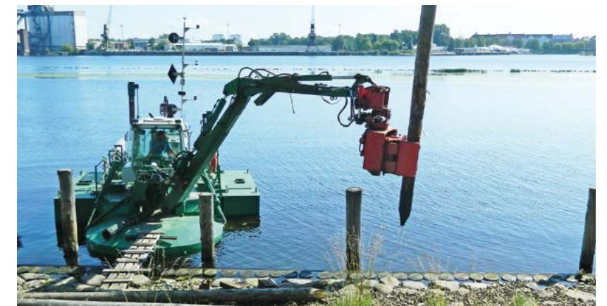
Desarrollar la seguridad y funcionalidad de las vías navegables - Watermaster se puede equipar con un hincador de pilotes vibratorio. Puede clavar tanto placas metálicas como pilotes de madera (imagen de Letonia).